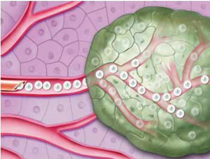
Die SIR-Spheres gelangen in den Tumor

Die Mikrokügelchen enthalten Yttrium-90, ein radioaktives Isotop. Diese Strahlung reicht im menschlichen Ge-