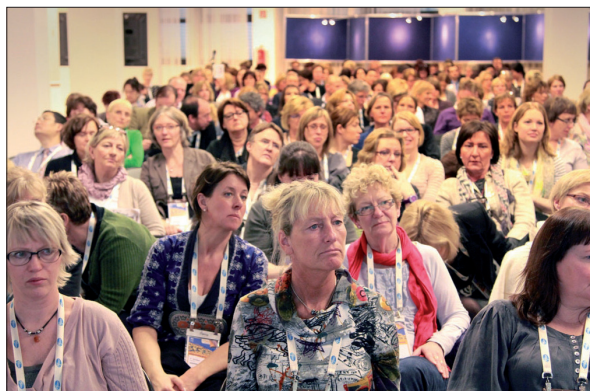
Die EAUN bringt urologischen Pflegepersonal aus der ganzen Welt zusammen

In 2011 ist die EAUN eine gut florierende Vereinigung mit über 2500 Mitgliedern, von denen die meisten aus der Europäischen Union stammen. Die Arbeitssprache der EAUN ist Englisch.