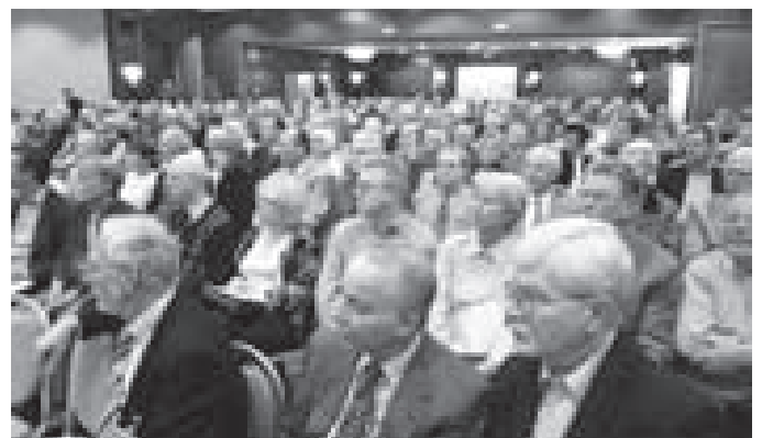
Interdisziplinäre Prostatakrebsgespräche, Hannover 2004

Sozialwissenschaftliche Untersuchungen belegen, dass der Besuch von Selbsthilfegruppen sogar therapeutische Wirkungen haben kann: So bezeugen Personen, die länger als ein Jahr an einer Selbsthilfegruppe teilgenommen haben, mehrheitlich eine Abnahme von Depressivität, einen Rückgang von körperlichen und seelischen Beschwerden, eine Zunahme von Initiative und Autonomie, eine verbesserte Kontaktfähigkeit, eine vermehrte Aufnahme intensiver Beziehungen zu anderen, eine Zunahme der Bindungsfähigkeit und eine erhöhte Bereitschaft und Fähigkeit, sich selbst und anderen zu helfen. Und damit nicht genug: Neben der (psycho-) sozialen