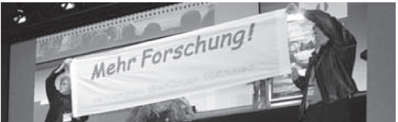
BPS-Symposium, DGU-Kongress Stuttgart 2008

Zum Schluss ein „fragwürdiges“ Ziel. Ist die Prostatakrebs Forschung nicht würdig genug, dass wir uns bisher nicht gefragt haben, warum gibt es in Deutschland keine private Förderung dieser Forschung? Sollten wir nicht beginnen, uns zu fragen, wie könnten wir das erreichen? Die Höhe der in Australien und den USA durch die Selbsthilfe geworbenen Spenden liegt im zwei- bzw. dreistelligen Millionen Bereich.