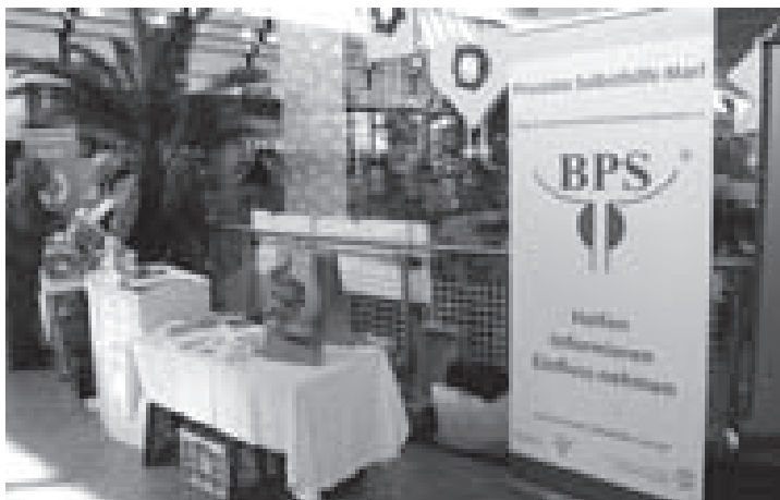
Marler Gesundheitstag, April 2009