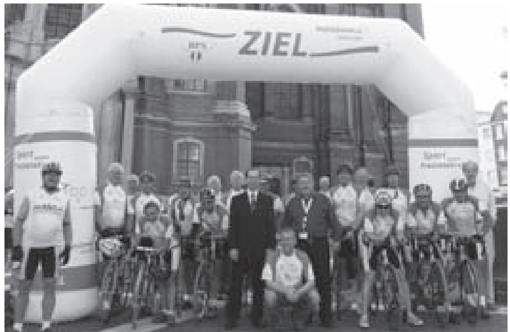
BPS-Radtour, Hamburg 2006