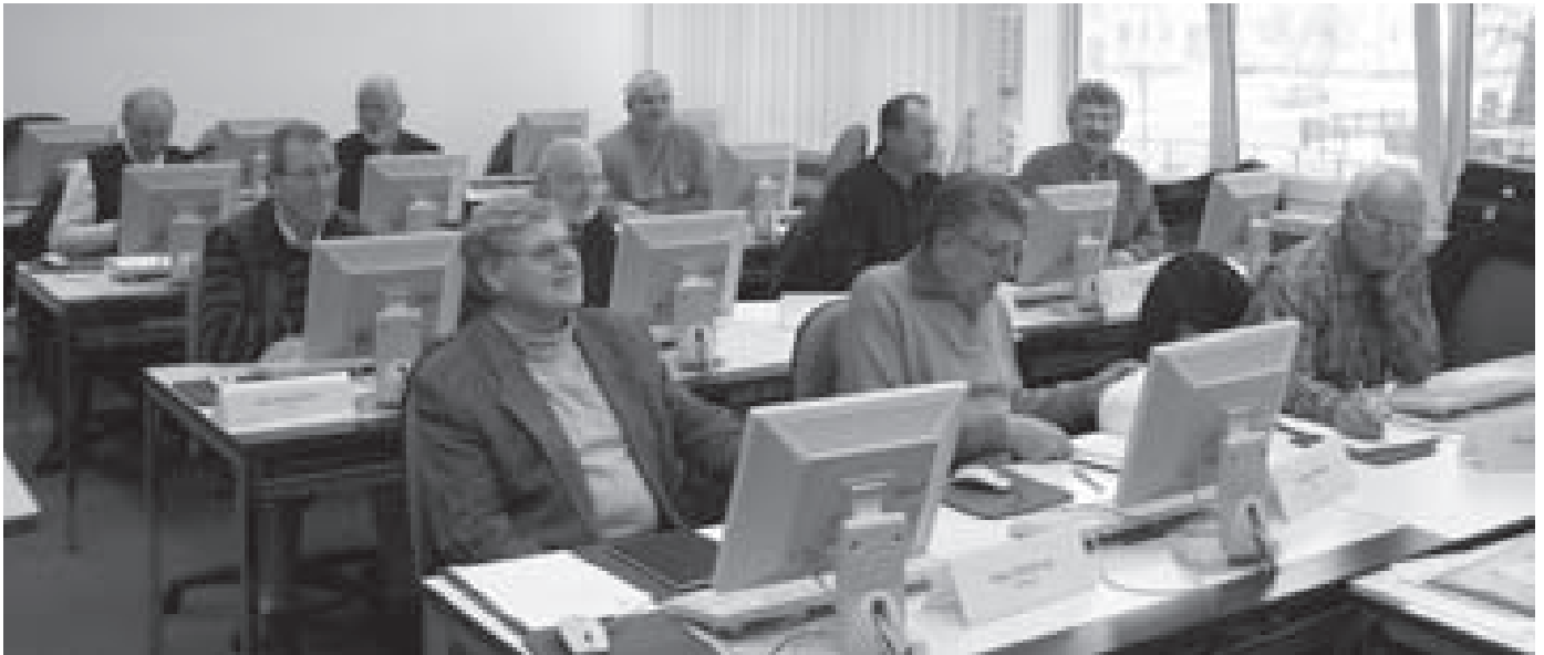
PC-Seminar, Gehrden 2007

rechtlichen Bereich, (z.B. Konflikte mit der Krankenversicherung, Beantragung eines Schwerbehindertenausweises oder ähnliches). Kurzum: Die Teilnahme an einer Selbsthilfegruppe macht aus Betroffenen informierte und mündige Patienten, die ihrer Krankheit oft kraftvoller und couragierter begegnen als andere. Durch das Informations- und Fortbildungsangebot für Selbsthilfegruppenleiter versucht der BPS, diese Effekte zu verstärken, indem er zur Qualitätssicherung der Selbsthilfearbeit beiträgt.